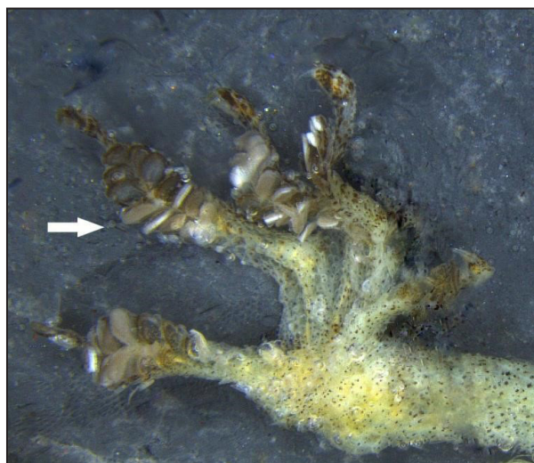
Figura 2. Pata trasera de Hemidactylus mabouia donde se observa que las almohadillas del IV dedo no llegan a la base del dedo.

2); subcaudales mediales agrandadas y dispuestas en series, pupila vertical y párpados ausentes (Krysko y Daniels, 2005). Este es el primer registro en la provincia de Jujuy, extendiendo la distribución conocida en Argentina 340 km al N del registro más cercano reportado previamente (Tucumán, Scrocchi et al. , 2019). Estos dos trabajos representan las primeras citas de la especie para la ecorregión de Selvas de Yungas.